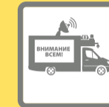
ПОДВИЖНЫЕ ЗВУКОУСИЛИТЕЛЬНЫЕ УСТАНОВКИ